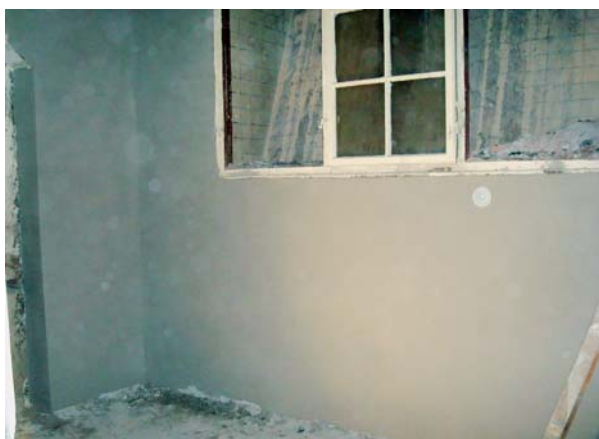
Po aplikaci sanačních omítek Baurex dle WTA.