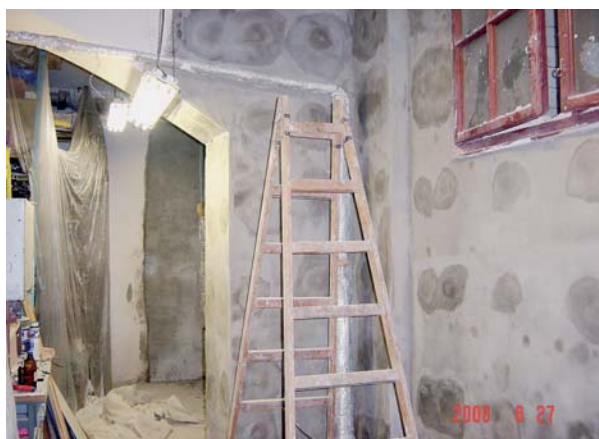
Aplikace hmoždinek a minerální stěrky.