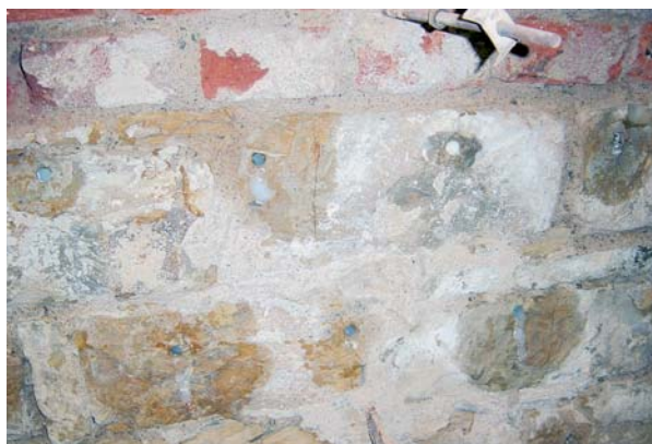
Případ, kdy se Injektcreme firmy Remmers ve vývrtu nerozpustil ani po uplynutí tří týdnů.

zabránil reakci opuky s cementem, který je obsažen v sanační maltě. Dále se vyplnily spáry a vyrovnaly nerovnosti vyrovnávací omítkou BAUREX dle WTA, do které se osadila výztužná skelná mřížka s oky 10 x 10 mm a následně se do mokrého mineralizačního nástřiku aplikovala minerální izolační stěrka Dichtungschlämme v první vrstvě. Aby bylo zabráněno případné separaci silného souvrství, byly tyto vrstvy přichyceny talířovými hmoždinkami délky 100 mm v minimálním počtu 10 ks/m 2 . Dále se aplikovala druhá vrstva minerální izolační stěrky Dichtungschlämme firmy BORNIT, do které se za mokra aplikovala sanační omítká