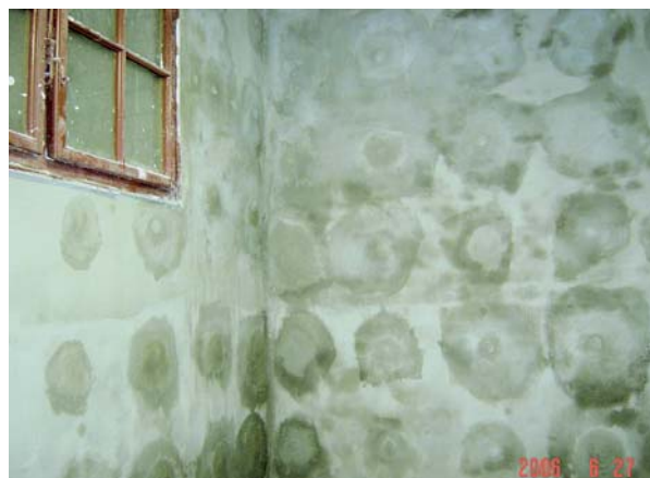
Finální pohled na ukotvení minerální stěrky pomocí výztužné mřížky a kotvičích talířových hmoždinek.