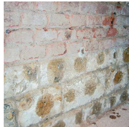
Stav po aplikaci injektážního krému, kdy se krém rozpustil