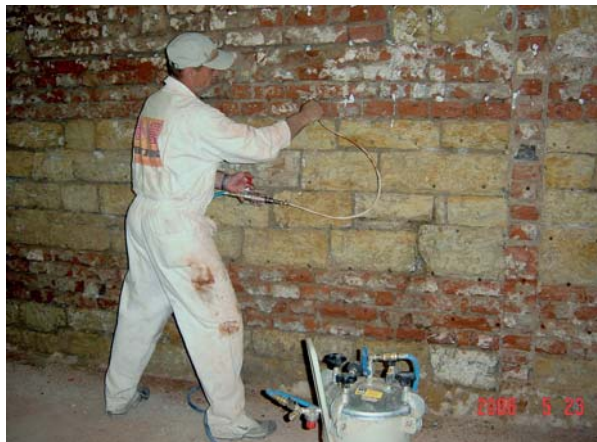
„Aplikace injektážního krému