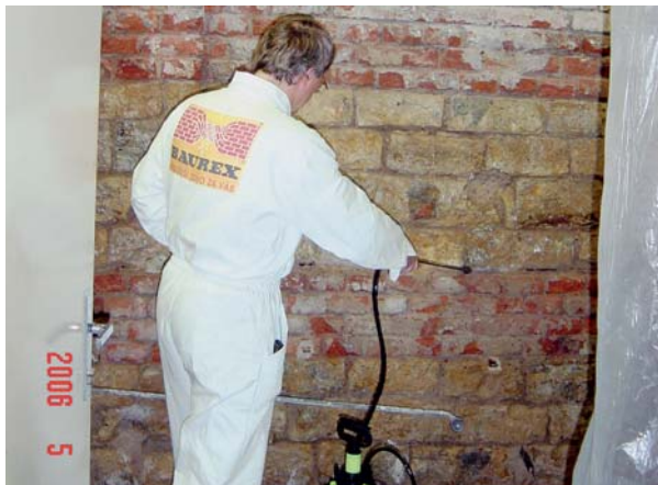
Napouštění opuky konzervačním prostředkem Anti Hydro.