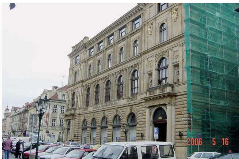
Pohled na palác v Rytířské na pražském Starém Městě při rekonstrukci.

Systémová komplexní sanace opuky zahrnovala nejen odstranění vlhkosti, ale také jejich příčin.