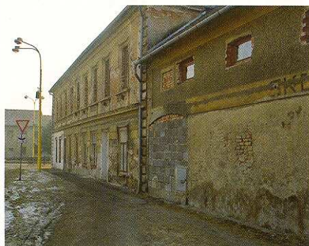
Obr. 1 Objekt v Tlumačově před sanací a po sanaci

Staré domy je třeba rekonstruovat s ohledem na jejich historii; je důležité zachovat jejich původní ráz a historickou atmosféru. V případě, že je nutné řešit příliš velkou vlhkost jejich zdiva, se často používají netradiční povrchové úpravy.