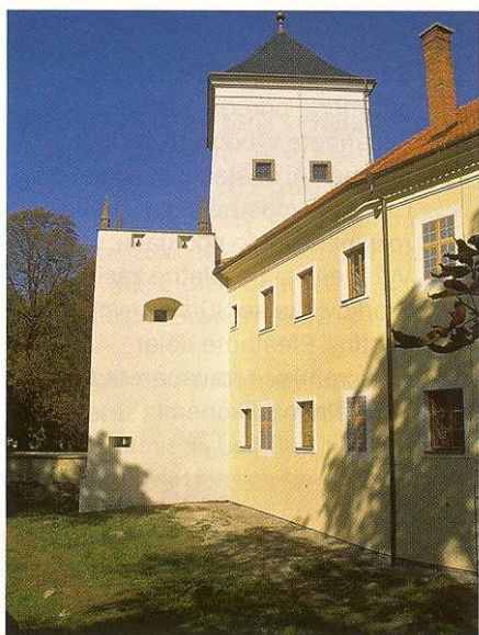
Obr. 2 Sgrafita na zámku Bystřice pod Hostýnem po aplikaci sanačních omítek (Baurex SMS)